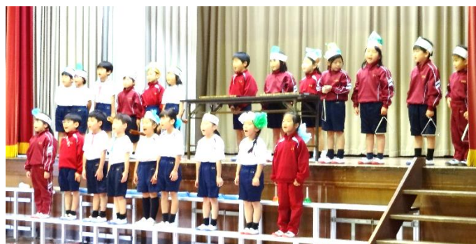
【1年生「なかよしのともだち」】

また、「赤い羽根共同募金」のお願いをしたところ、10,066円の募金が集まりました。この募金は、酒屋地区社会福祉協議会を通して三次市共同募金委員会へお渡しします。ご協力、ありがとうございました。