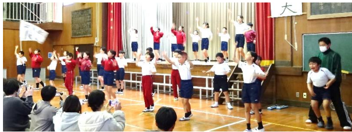
【5年生「備えよう!もしものために!」】