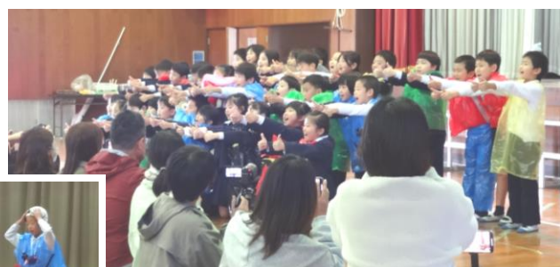
【3年生「ロード オブ ザ ピオーネ」】