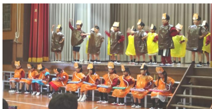
【2年生「動物園の飼育員」】