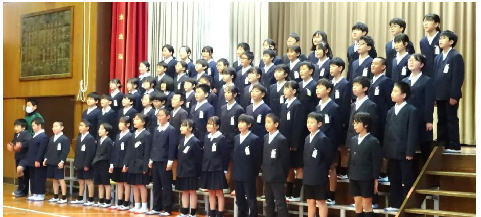
【5・6年生「届け ぼくらのふるさとに」～リンクアップコンサートより】