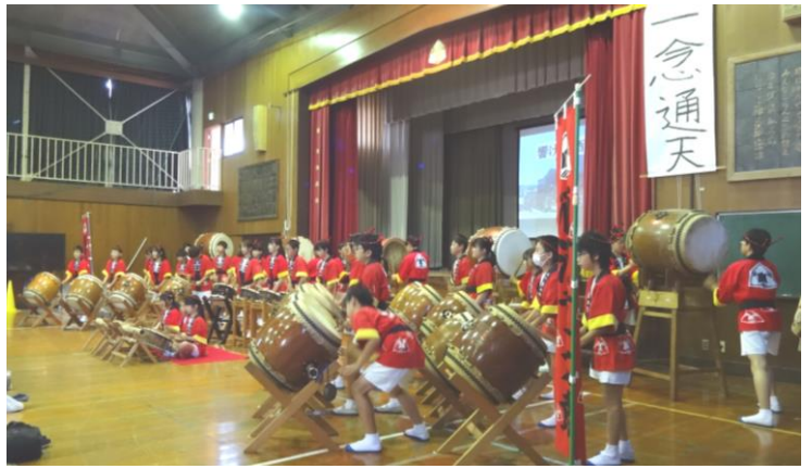
【6年生「響け!酒河童太鼓」】