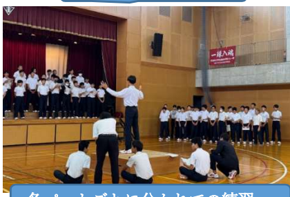
各パートごとに分かれての練習