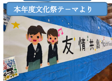
本年度文化祭テーマより