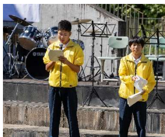
生徒会執行部 総司会頑張りました。

塩町中学校では、本校の吹奏楽部や三次青陵高校の軽音楽部、県北のバンド、ダンスチームが出演し、グラウンドゴルフや軽食コーナーもありました。司会は、本校生徒会執行部や三次青陵高校の生徒の皆さんによって進行されました。本年度からのコミュニティ・スクールの一環として、学校と地域とが一体となって取り組み、これからのまちづくり・人づくりの可能性を実感することができました。