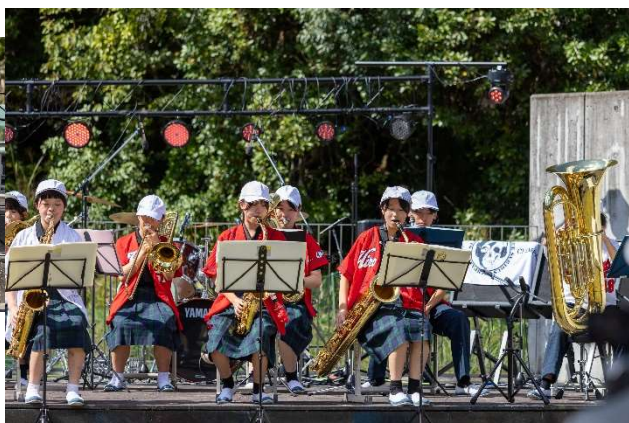
吹奏楽部、炎天下の中、日頃の 練習成果を発揮しました。