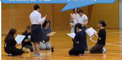
本番での並びを想定して!!