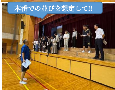
本番での並びを想定して!!