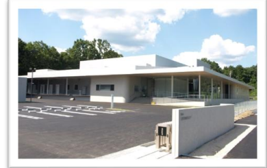
三次学校給食センター