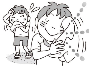
汗ふきタオルを持参しよう