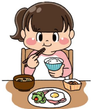
ご飯をしっかり食べよう