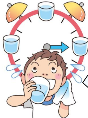
忘れずに水筒を持参しよう