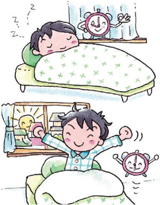
早寝・早起きをしよう