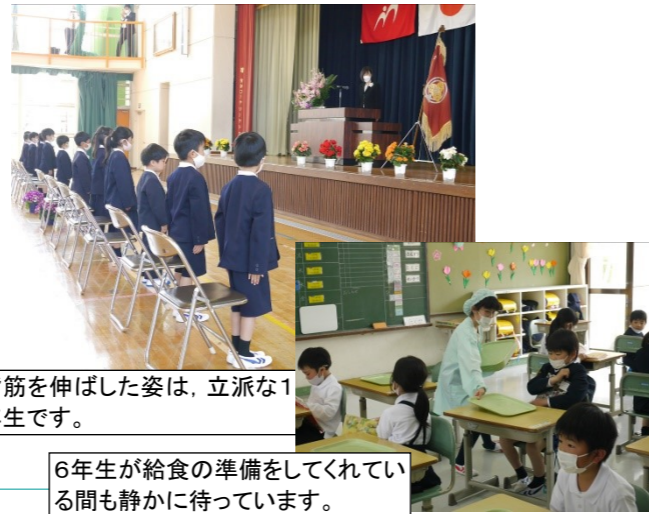
背筋を伸ばした姿は、立派な1年生です。