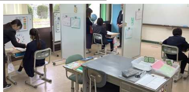
ひまわり学級、国語の授業