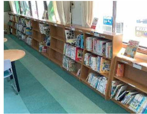
学校図書館にある三段の書架は、旧八幡小から譲り受けた書架です。

4月15日水曜日には、吉舎町の読み聞かせグループ「りんく」の方々が読み聞かせに来てくださいました。今年度も、「りんく」のみなさんに毎週水曜日に来校いただき、児童に本に親しみ、楽しむ豊かな時間を作ってくださいます。今年度もよろしく願いいたします。