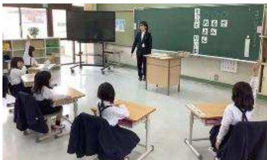
1年生5名、国語の授業

4月17日金曜日の授業参観日、学級懇談会、P T A 総会等にご参加いただき、ありがとうございました。どの学級の児童も保護者のみなさんに見ていただき、張り切って学習していました。「自ら学び、考え、自立した行動ができる『きさ』の子どもの育成」を目指し、保護者と地域の皆様のご協力をいただきながら、吉舎小学校の全職員で取り組んでまいります。