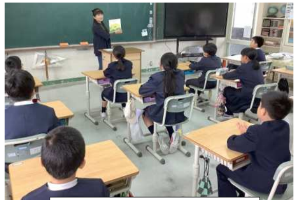
「りんく」さん、読み聞かせの様子