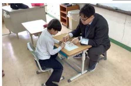
たんぼぼ学級、算数の授業