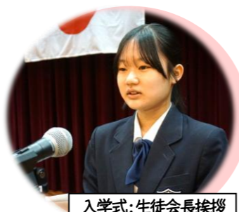
入学式:生徒会長挨拶

さあ、わくわくする一年のスタートです！十日市中学校の校訓である「高い知性・うるわしい人格・たゆまぬ勤労」の精神を胸に、五感をフルに発揮して一日一日を大切に積み重ねていきましょう。