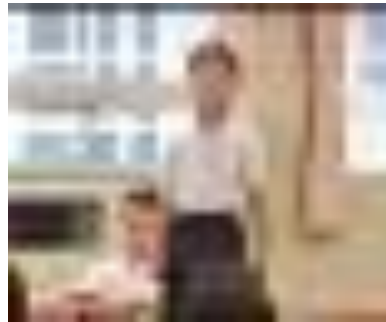
「夏休み 心に残った事を発表しています」