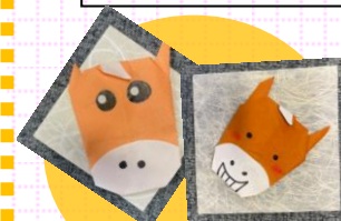
↑生活3学級「自立」の授業での作品

「こういうのはどうかな」「こうやったらもっといいのでは」活発なやりとりに、リーダーとしての頼もしさも感じられます。