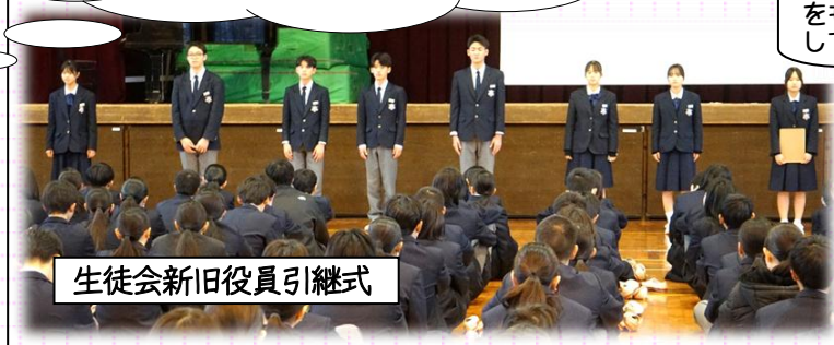
生徒会新旧役員引継式