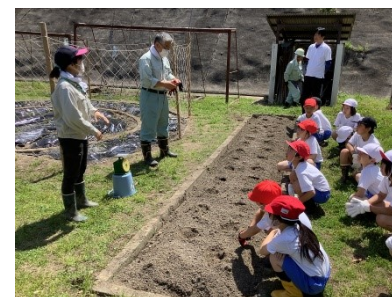
よろしくお願いします。