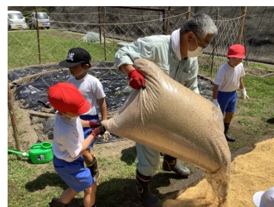
もみ殻のお布団をかけて、たっぷり水をやりました。