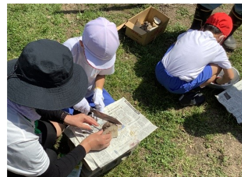
種芋を切ることも体験。