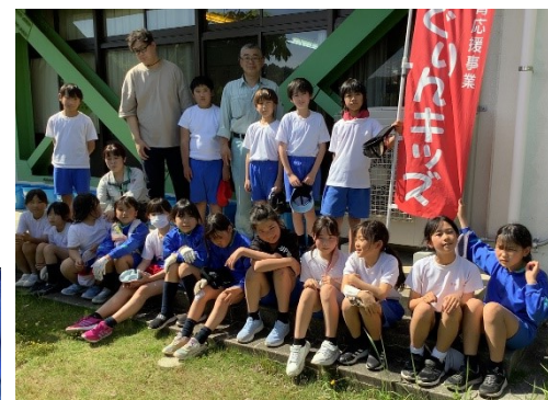
汗をいっぱいかきました。みんなで記念撮影！