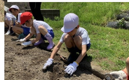
優しく優しく土をかけます。