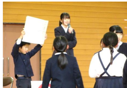
6年生にちなんだ〇×ゲーム