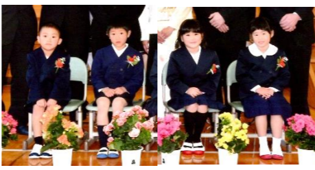
おまけの写真：「入学式直後」の6年生