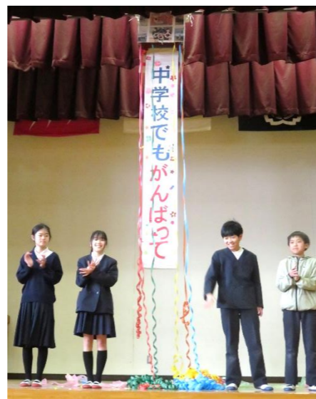
くす玉割りをした6年生