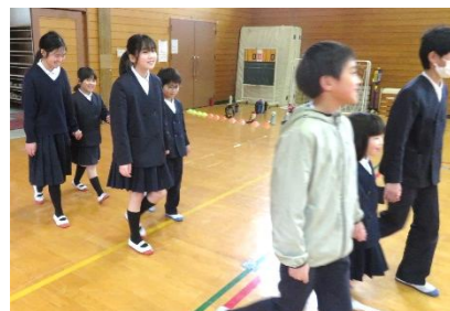
1年生に連れられて入場する6年生

6年生にちなんだ〇×ゲームや校舎内に隠れた6年生を探すゲーム、さらに、6年を振り返った6年生4人+αによる劇を楽しみました。