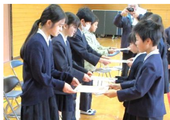
在校生によるプレゼント渡し