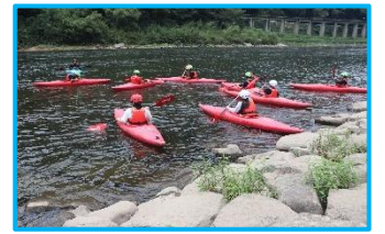
カヌー体験学習(全学年)