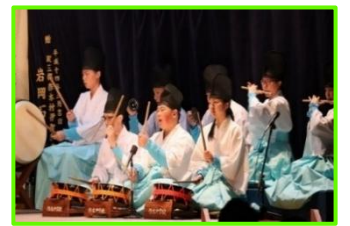
<地域の文化継承プロジェクト(2学年)> 神楽「大江山」の上演(学習発表会にて)