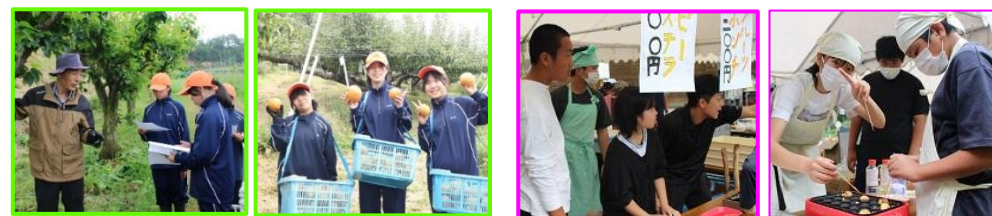
＜地域の魅力化プロジェクト(1学年)＞ 高丸農園体験学習 ＜地域貢献・発展プロジェクト(3学年)＞ さくぎふるさと祭りへの出店