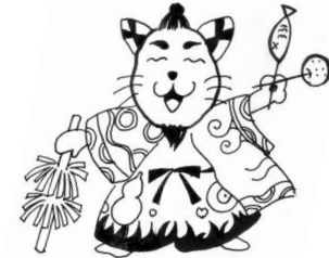
かぐにゃん (作木中学校イメージキャラクター)