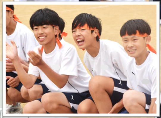
1学年種目「カンカンカウボーイ」