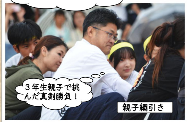
3年生親子で挑 んだ真剣勝負!