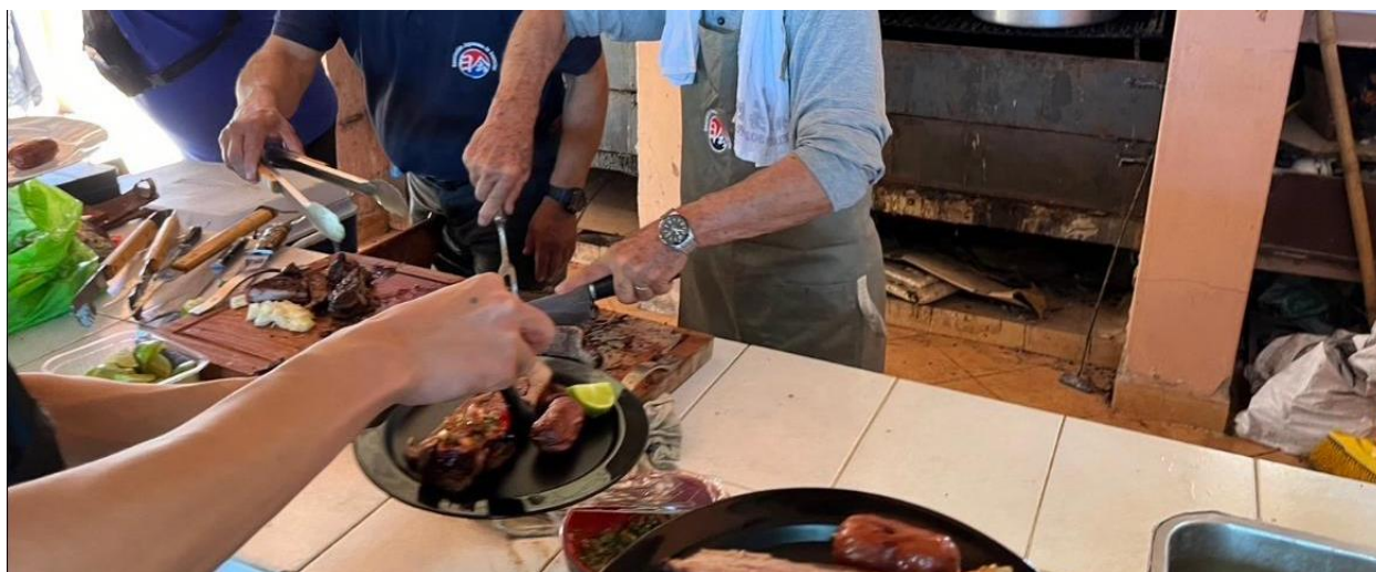
【昼食は朝から焼いていたアサードを豪快に切っていただきました=同上】