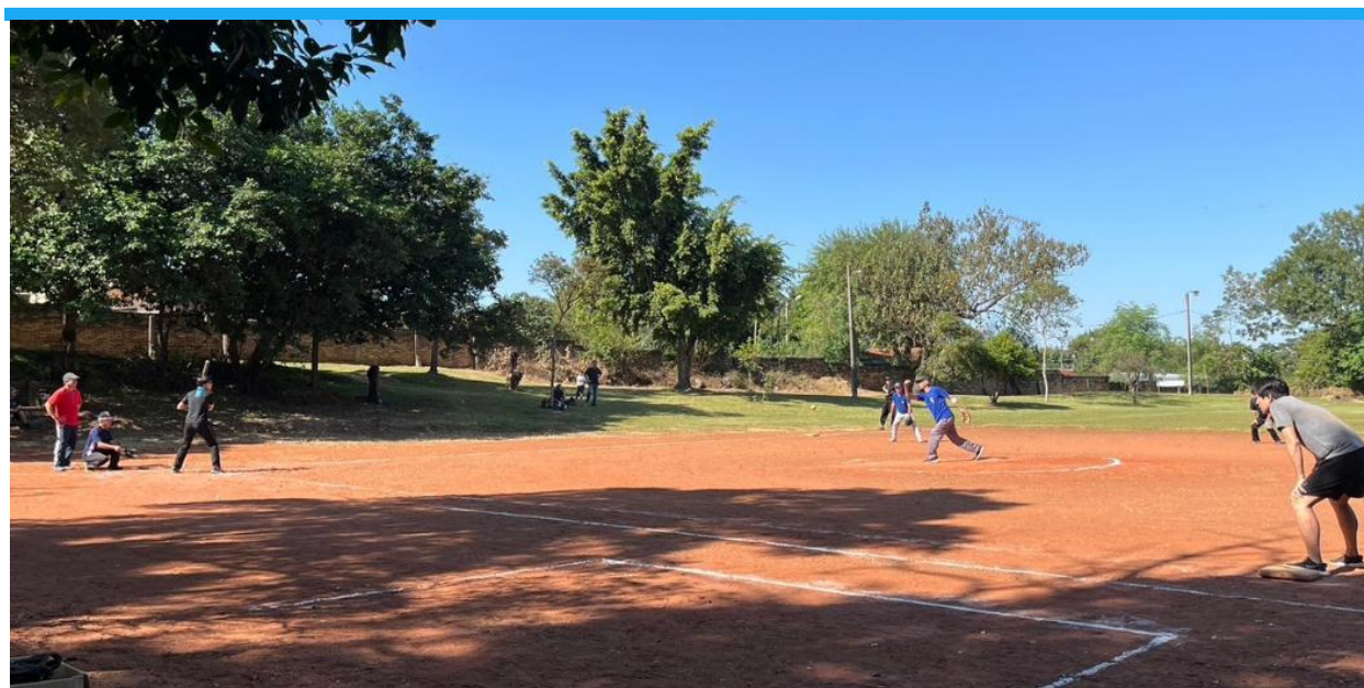
【日系人チームと親善試合（打者は私）=Japanese Association of Asuncion Sport Complex：6月2日】