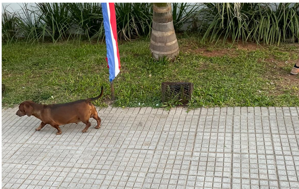
【ダックスフンドの野良犬？＝三育幼稚園前：5月30日】

小型犬もいます。こちらは飼い犬も放し飼いが多く、道路を自由に歩き回っています。写真はダックスフンドです。少し珍しいと思って写真をとりました。かわいいのですが、野生の動物は病気を持っていることがあるので近寄ったり触ったりはできません。そういえばこの前、公園に牛が座っていました。その時はびっくりして写真を撮り忘れてしまいました。今度見かけたら写真を撮って紹介しますね。