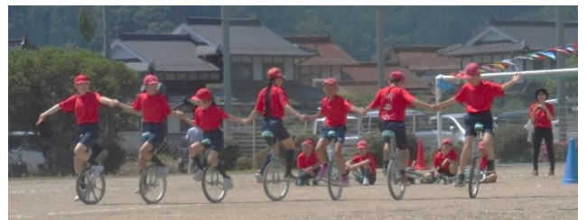
5・6年生 みんなでスピードに乗り、大きく回転。そして、前進・後進・前進・後進で手を繋いでスタート、