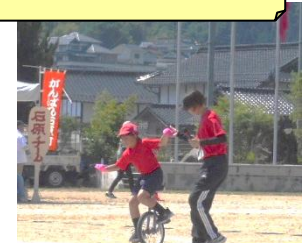
2年生 さすがです。安定しています。