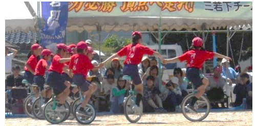
3・4年生 息を合わせて集団で演技ができるようになりました。みんなで手をつないで一列で進みます。