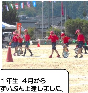
1年生 4月から ずいぶん上達しました。