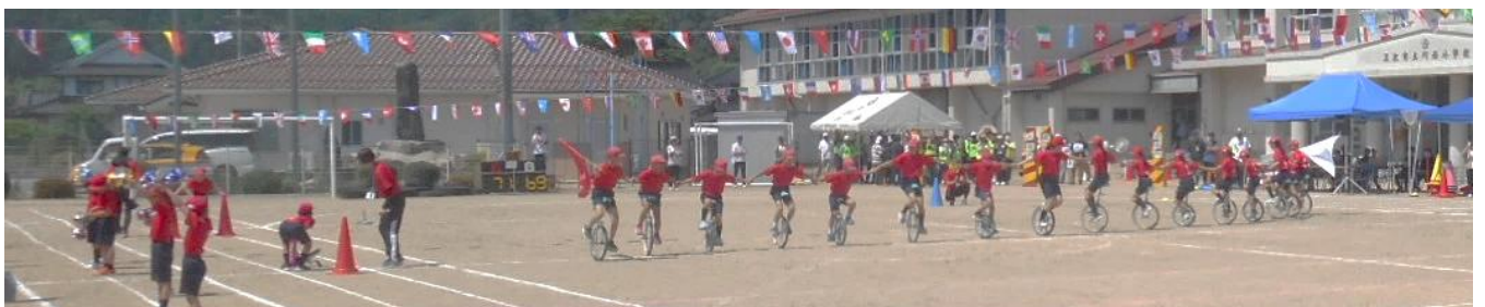
最後は全校での集団演技 1年生は応援、2年生は再び技を披露。3年生以上は手をつなぎ、一直線に横一列で回転する大技。