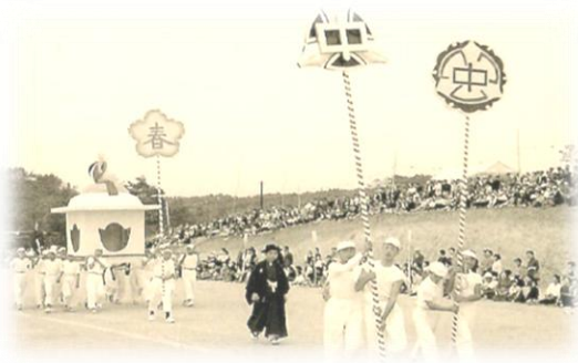
三和中学校が開校し落成を祝う行事