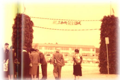
三和中学校が開校

三和町は昭和30年(1955)3月31日、旧双三郡板木村の全域と旧世羅郡津名村・上山村のうち敷名の地域を合併して誕生しました。三つの地域が一つの和の精神にとけ合って結合した意味を含めて合併住民の総意により『三和』と名付けられたとあります。当時の世帯数は1,400戸、人口7,200人(令和2年10月1日現在、1,075世帯、2,542人)だったことが書かれています。中学校の沿革には、昭和33年(1958)4月1日に、三和町立板木中学校と三和町立三和東中学校を統合し、『三和町立三和中学校』として開校とあります。それから69年目を迎え、この68年間に4,286名もの卒業生を送り出しました。今年は3名の新入生を迎え、全校生徒31名での新しいスタートです。31名の生徒がこの学び舎でしっかりと学業に励んだり、友人と人間関係を築いたりして、人としての確固たる土台を築いてほしいと願っています。少人数ならではの良さや強みを活かしながら、将来は三和の地で、または、三和から離れていても三和のことを気かけながら、より良い社会の一員として活躍・貢献してくれることを願いながら日々の教育活動を行ってまいります。