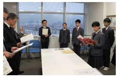
三次市教育長訪問

銀山街道日本遺産認定に向けて文化庁を説得する資料に活用される。他、多数の反響あり。