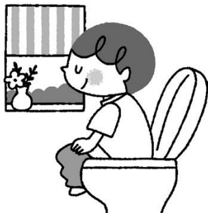
まいあさ 毎朝きもちよく排便する