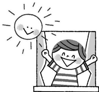
はやお 早起きしてあさひをあびる