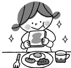
ちようしよく 朝食をたべてエネルギー補給