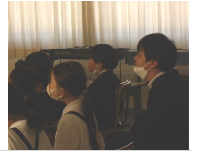
「怖い話」の部屋。興味津々で聞く子供たちでした。