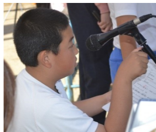
係の仕事、役割...リードしてくれてありがとう!6年生