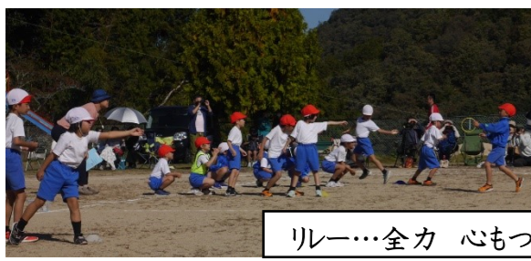
リレー...全力 心もつなぐ