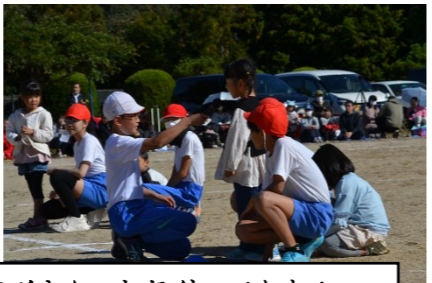
保育所さん。来年待ってます!