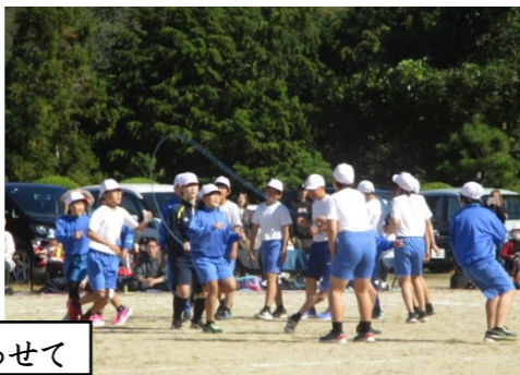
団体競技...協力 カと心を合わせて