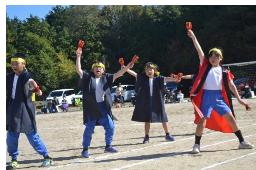
表現 楽しくチャレンジ! その姿はカッコいい!