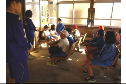
吉舎駅…中学生の司会でシェアリング