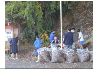
田尻バス停…これだけ集めました!