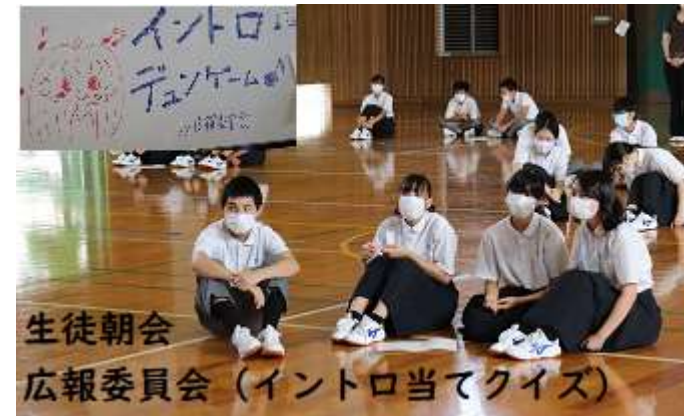
生徒朝会 広報委員会(イントロ当てクイズ)

JICA 中国は、吉舎中学校が、今年度初めての訪問校だったそうです。食事は、本校だけの貸し切りにしていただき、感染対策もバッチリで、いい研修をさせていただきました。