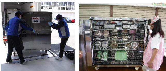
【8月中に給食配送のリハーサルを行いました】

9月から三次給食センターで調理した給食がトラック配送されるようになります。今後も安心安全で美味しい給食を提供するため、児童の感想やお気付きの点等ありましたら、学校にお知らせください。