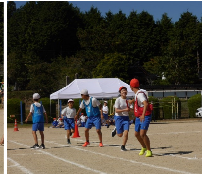
5・6年 紅白リレー 力強い走りを見せてくれました。走順を話し合いながら、何度も走りました。その結果、本番では接戦となりました。