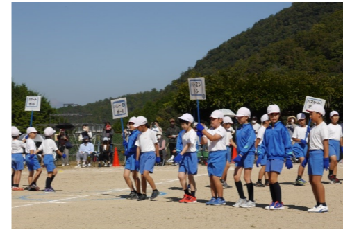
吉舎小版オリンピック 2021 ポーズは自分たちで考えました。きまってるでしょ。

3・4年生 どの種目も生き生きとしていた3・4年生。助け合って練習してきたことが本番でも生きていましたね。