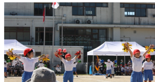
マスカットでまあスカッとダンス