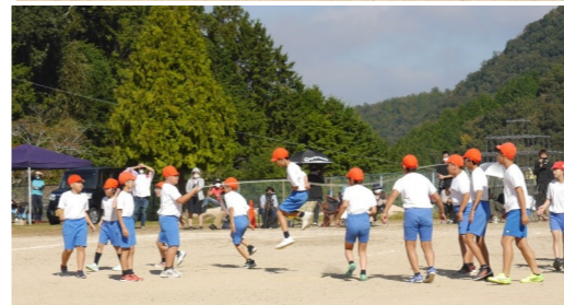
心をひとつに Let's jump! さすがの高学年でした。長縄跳びは、縄の回し手のコツも重要です。