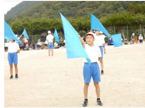
5・6年生：ダンシング・フラッグ～同じ景色を見よう～ 一人一人のがんばりだけでなく、そろえる美しさもみせてくれました。