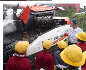
【上段】3・4年 ブドウの収穫 【下段】5・6年 稲刈りと脱穀

※ 1・2年生のサツマイモ掘りは、信貞地域資源保存会の方々と一緒に10月3日(火)に行う予定です。