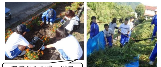
環境美化作業の様子

おかげで、学校の環境も整い、生徒、教師共に整備された環境のもとで学校生活を過ごせています。