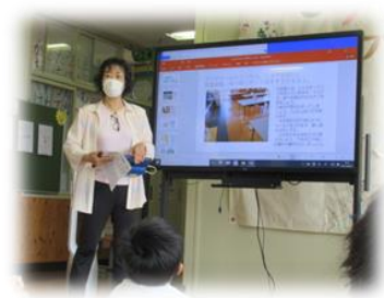
9月1日に秋久養護教諭が、改めて感染症予防で気をつけてほしいことの話をしました。

「変異株」への置き換わり等により新型コロナウイルス感染症の収束は依然として先が見えず、予断を許さない状況ではありますが、9月1日より新学期をスタートすることとなりました。河内小学校においては、三次市教育委員会の方針に則り、引き続き感染症対策を行いつつ、子供たちの健康・安全に配慮してまいります。