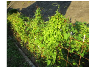
毎日水やりをがんばった3年生。