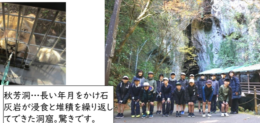
秋芳洞…長い年月をかけ石灰岩が浸食と堆積を繰り返してきた洞窟。驚きです。