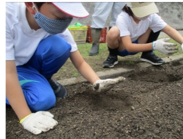
5月14日 種いもを植えました