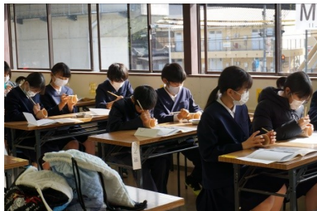
萩焼 絵付け体験…真剣です