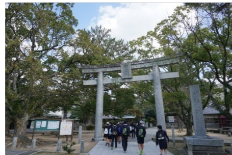
松陰神社…実存する松下村塾も見学