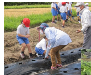
9月24日 種まきをしました