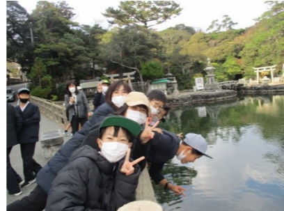
明神池…池だけど海水なので、海の魚がいます