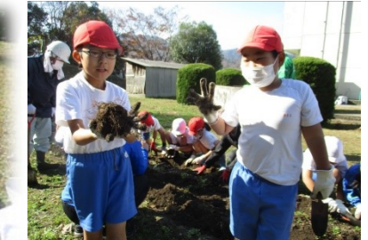
11月17日、JAさん、校務員さんと一緒に収穫。立派な山の芋に歓声が上がりました。