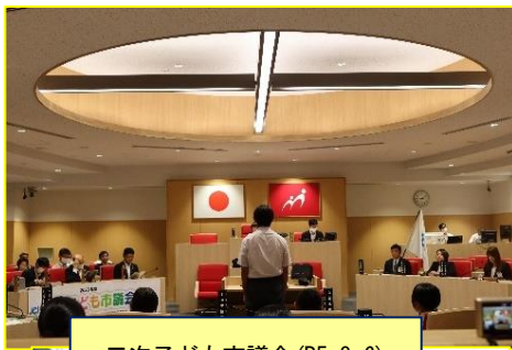
三次子ども市議会 (R5. 8. 6)