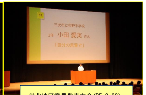
備北地区意見発表大会 (R5. 8. 22)