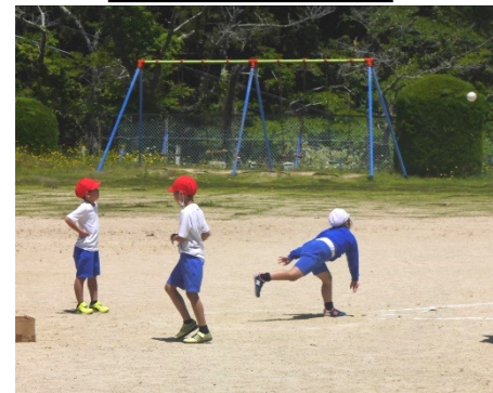
ソフトボール投げ