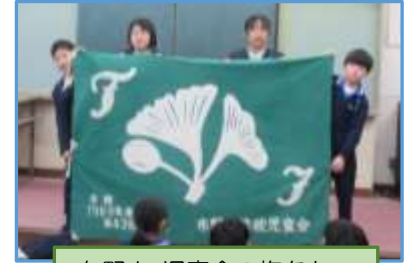
布野小 児童会の旗をもつ 新役員4名

布野小学校では、1年間を前期と後期の2つの期間に分け、全校のみんなの選挙により選ばれた役員が中心となって児童会を運営します。6年生の卒業に伴い、4月から始まる令和6年度前期の役員を選出する選挙を行いました。