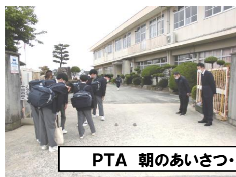
PTA 朝のあいさつ・昼の見守り活動