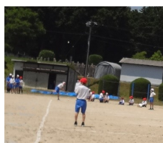
ソフトボール投げ