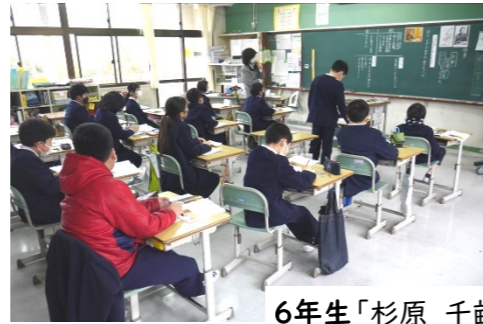
6年生「杉原 千畝」 大勢の人の命を救った外交官