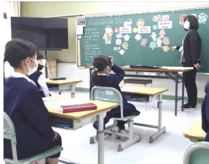
1年生「きゅうしょくとえいよう」

多数のご参観ありがとうございました。見ていただくと子供たちも教員も張り切ります!