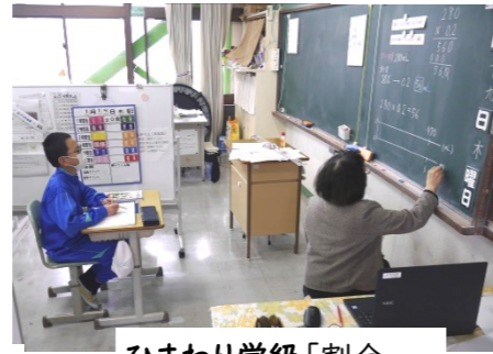
ひまわり学級「割合」