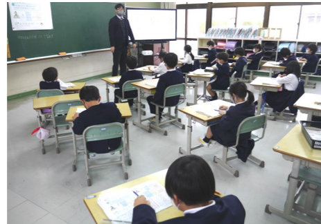
2年生「1000より大きい数」