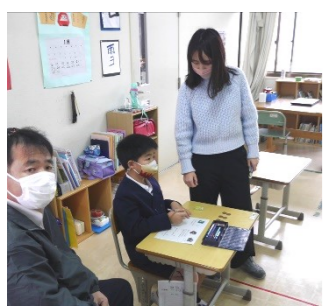
たんぼぼ学級「ナゾトキ」