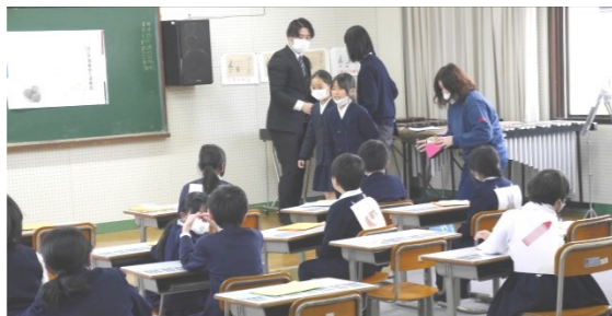
3年生「吉舎特産 山の芋」

総合的な学習の時間に自分たちで調べたことを新聞にまとめて発表しました。音楽の「山のポルカ」も聴いてもらいました。 この写真は、「わたしはだれでしょう?」ゲームの場面です。