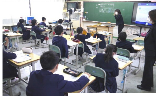
4年生「変わり方調べ」