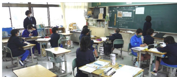
5年生「単位量当たりの大きさ」