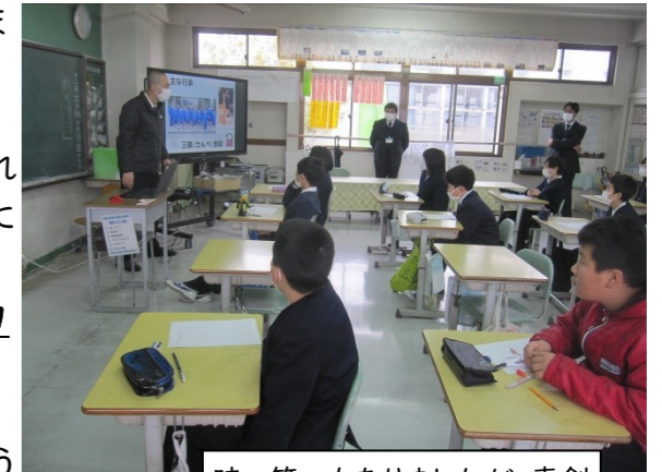
時々笑いもありましたが、真剣に話を聞く6年生です。

吉舎中学校区では、「表現力の育成」を研究テーマにしています。ただ表現する技術を身に付けるのではなく、様々な体験を通して、自分を見つめ、自分の言葉で考える、その上で表現することを大切にしていきたいと思っています。