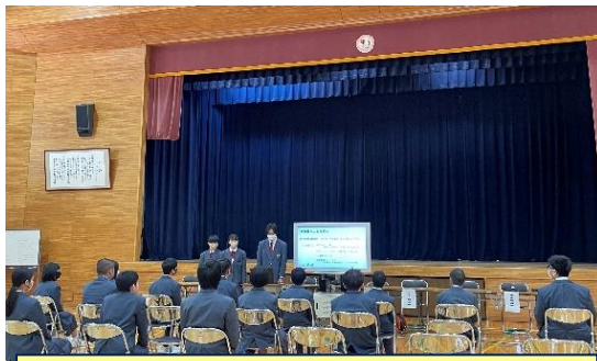
生徒会オリエンテーション（生徒会執行部の説明）