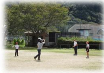
外でバドミントンをする5・6年生