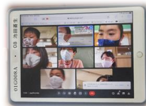
Googleclassroom でつながる子どもたち

新型コロナウイルス感染症拡大防止のため、体調がよくないときは家庭で過ごしていただくこともある状況です。そこで、家庭で過ごす児童と学校が双方向でつながり、リモートで健康観察や授業を行うための準備を行っています。9月17日（金）には、午後7時より、家庭と学校がタブレットを使ってリモートでつながることができるかのテストを行いました。全てのご家庭で、担任の端末とつながることができ、まずは大成功でした。ご協力いただきました保護者の皆様、ありがとうございました。