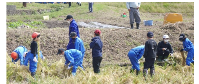
約60kgのお米が収穫できました。