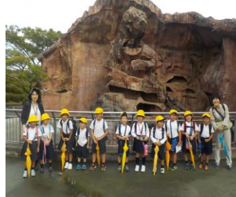
1年生 ヒヒ山の前で記念写真をパチリ!

9月27日(金), 1~3年生は, 安佐動物園に行きました。1年生の一番人気は, ミアキャットでした。4・5年生は, 広島市こども文化科学館・造幣局広島支局に社会見学に行ってきました。広島市こども文化科学館では, 多くの実験を体験しました。児童がとても印象に残ったのは, 空気圧の実験でした。