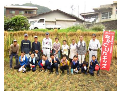
今年は豊作でした!