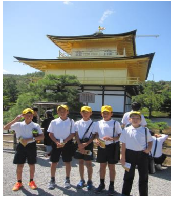
最高の天気の中, 照り輝く金閣を見ました!

初めて見たこと, 知ったこと, みんなで集団行動すること, 施設や見学地で知り合った人とのあいさつ等, 学校では, 体験できないことを学習してきました。