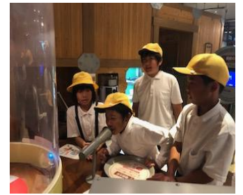
声が伝わる実験をしています!