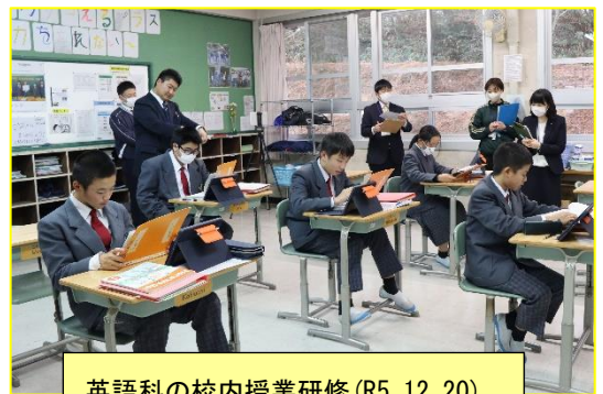
英語科の校内授業研修 (R5. 12. 20)