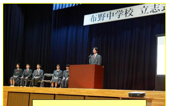
布野中学校立志式 (R5. 10. 22)