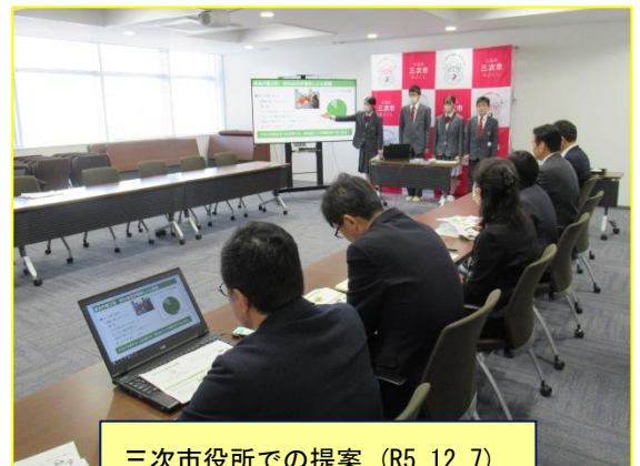
三次市役所での提案 (R5. 12. 7)