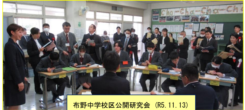
布野中学校区公開研究会 (R5. 11. 13)

「自分の人生を選択する力」「表現する力」を、試行錯誤しながらも身に付けてきています。その力をもって、今、全員の進路実現に向かっていきます。