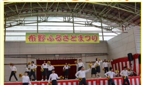
布野ふるさとまつりに全校生徒が参加 (R5. 10. 29)