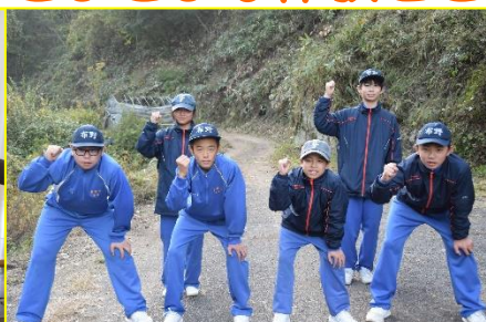
地域活性化のために動く (R5. 11. 1)