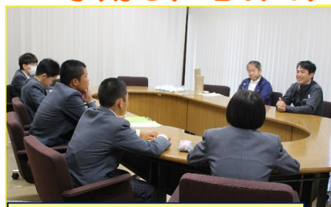
地域の方へインタビュー (R5. 11. 7)