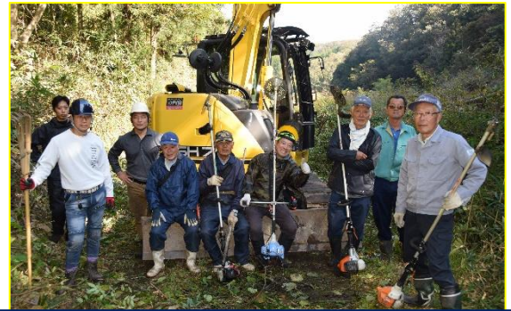
八千代滝への道整備に力を貸してくださった地域の方々

布野中学校はこれからも「地域と共にある学校」として、保護者・地域の皆様と共に、自らとふるさとに誇りをもつ生徒を育て布野の人づくり・まちづくりへとつなげてまいります。今後とも、ご理解・ご協力のほど、よろしくお願いいたします。