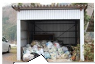
布野中 アルミ缶回収場

PTA活動として行っておりますアルミ缶回収に、保護者の方をはじめ、地域の多くの方にご協力いただいておりますことに感謝申し上げます。 本年度、平成31年2月19日現在、1,500kgのアルミ缶を業者に引渡し、112,770円の収益を得ることができました。 生徒が学習で使用するファイルや実力テストの費用、1年生には熱中症対策用の帽子を購入させていただきました。 今後も、生徒の学習や活動を後押しできるものに支出していきたいと考えておりますので、引き続きご協力をお願いいたします。