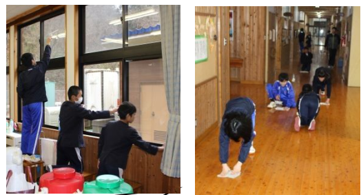
窓、廊下等を清掃している様子

3月6日(水)、地域ボランティア活動として毎年行っている横谷ふれあいセンターの清掃活動を、普段お世話になっている地域への感謝の気持ちを込めて、今年も小中合同の活動として1,2年生と小学校6年生が一緒に行いました。