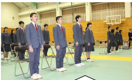
卒業証書授与式の予行の様子

明後日3月10日(日)、第72回目の「布野中学校卒業証書授与式」を挙行政いたします。 手渡す卒業証書は、3年生の皆さんがこの布野中学校の歴史と伝統を立派につないだ一人であることの証であるとともに、誇りだと思います。大切に受け止めて欲しいと思います。 3年生は、3年間何事もがんばってきました。特に最上級生となった今年度は、勉強、部活動、生徒会活動等に、全校のリーダーとして力を発揮してきました。