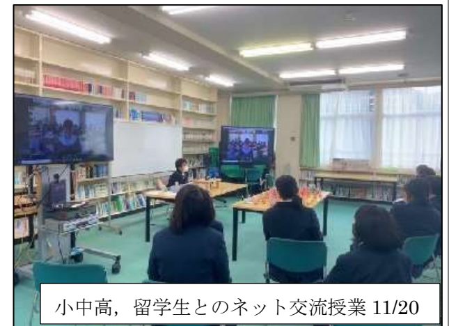
小中高、留学生とのネット交流授業 11/20