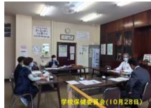
学校保健委員会(10月28日)