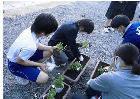
古市の商店街にプランターを置いてもらいました