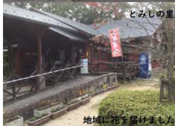
地域に花を届けました