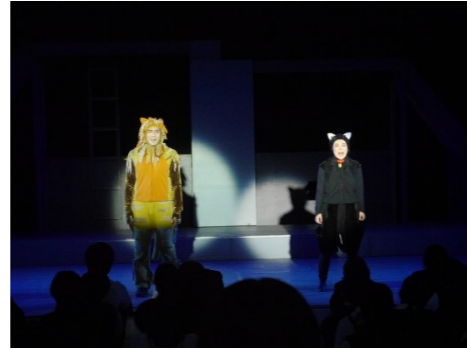
「ルドルフとイッパイアッテナ」 飼い猫のルドルフが迷子になって出会ったのが野良猫の親分イッパイアッテナ。イッパイアッテナはたくさん名前を持っていて、なんと字が読める猫。2匹の出会いが化学反応を起こし…。楽しくて、感動するお話です。