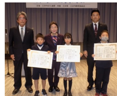
11月26日(日)まちづくりセンターで表彰式がありました。

1月7日(日)~26日(金) 「吉舎歴史民俗資料館」に 展示されます。 また、同じ期間「あーとあ いきさ」にて、町内の園児・ 小学生の作品を展示いた だきます。