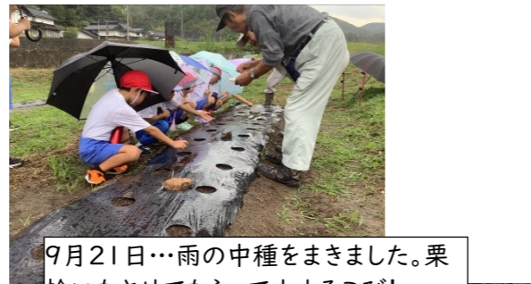
9月21日...雨の中種をまきました。栗拾いもさせてもらって大よろこび!