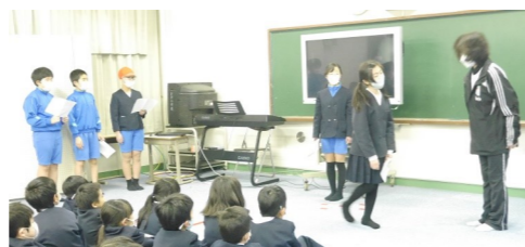
「挨拶されても、顔も見ずに軽い会釈で通り過ぎる例」こうしてみると、気持ち伝わらないのがわかります。

その後には、実際に玄関に立ってあいさつ運動もしてくれました。引き継ぎたいですね。