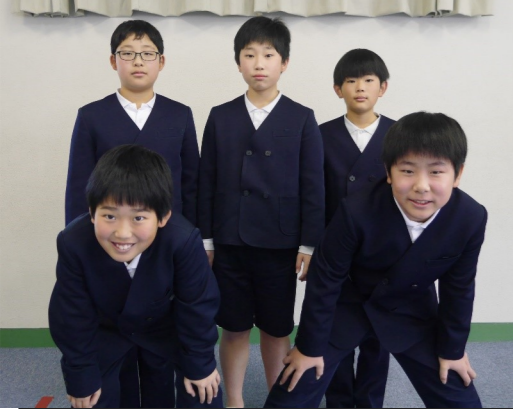
令和5年度 前期児童会役員メンバー