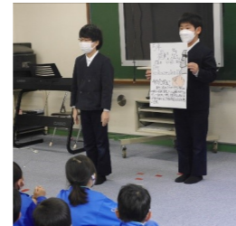
最後の演説…応援者も真剣です。

5名の役員に、5名の立候補でしたが、学級みんなで児童会役員選挙に向けて準備してきた5年生です。子供たちだれもが誰かの役に立ちたいという気持ちを持っているものですが、立候補するという行動に移すことはとても勇気のいることです。みんなで選んだ役員5人、しっかり応援していきましょう。