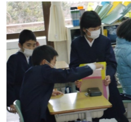
投票…選挙管理委員もしっかり準備していました。