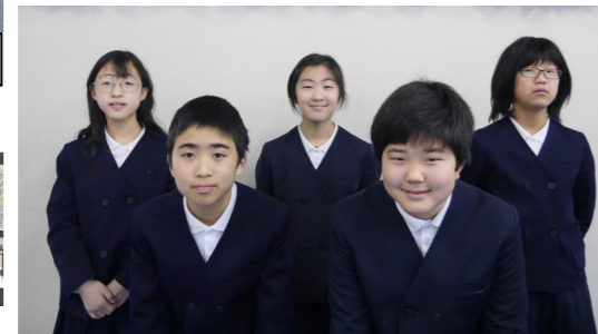
令和4年度 後期児童会役員メンバー

「だれとでも協力し合える」「みんなが仲良くケンカがない」「人を大切に笑顔になる」「大きな声であいさつできる」「当たり前のことができる」そんな学校にしたいと意気込みを語ってくれた5人です。