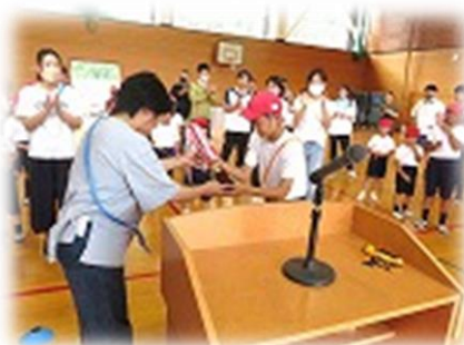
トロフィーを受け取る2班