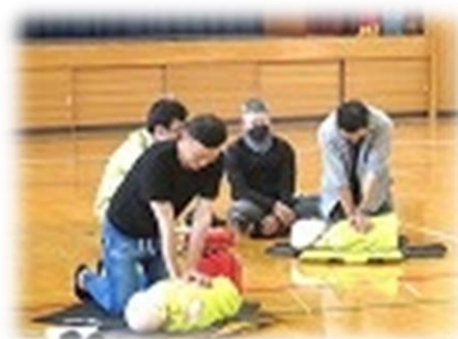
救急法講習会の様子