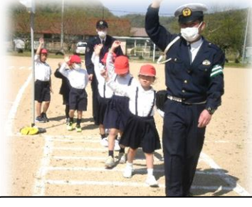
横断歩道の渡り方指導