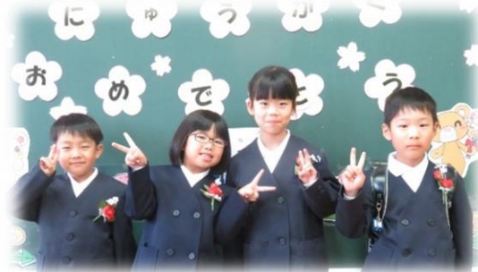
入学式後の教室にて