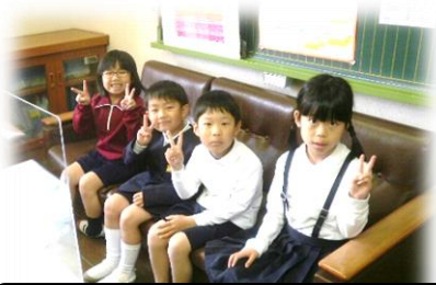
校長室のソファに座って

新1年生4名が、校長室を訪問し、自己紹介しながらかわいらしい絵をプレゼントしてくれました。1年生さん、小学校の授業で初めて描いた絵をありがとう。