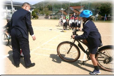
自転車の乗り方指導