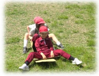
ダンボールで草（芝生）滑り

5月2日（火）、風土記の丘を目的地に“1年生歓迎遠足”。学校から約6.6km歩いて到着すれば、全校レクに、お弁当に、草滑りにと楽しいことがいっぱい。1年生も大喜び！