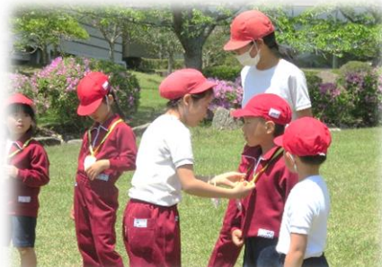
プレゼントをもらう1年生