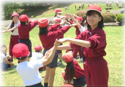
児童会が考えた全校レクを楽しむ

4月11日（火）、交通安全教室を開催し、川西駐在所、三次警察署、交通安全協会の皆様に、安全な横断歩道の渡り方や正しい自転車の乗り方・点検の仕方をご指導していただきました。