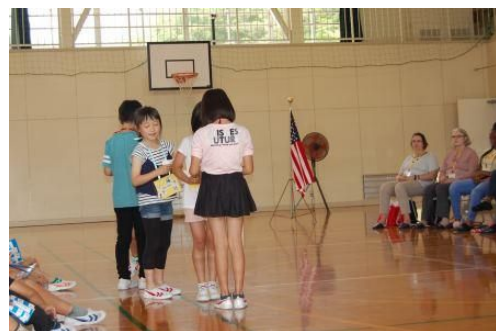
緊張しながらも英語で名刺交換のデモンストレーションができました ^ ^

今日、アメリカス市との交流会がありました。三・四年生でしました。はじめに、司会が「レッツプレイネームカードエクステンジゲーム。」と言い、みんなが「イエーイ！」と言って交流会がはじまりました。でも、わたしは、「イエーイ！」というのをわすれていて、みんなから少しおくれました。次は、わたしのセリフの番です。きちんとしようして「デモンストレーション。プリーズ ウォッチ アス。」と言おうと思ったのに、「ドウ ユー ハブ エニー クエスション。」とまちがえてしまいました。でも、友だちがそつと教えてくれました。アメリカス市の人にちゃんと英語で言えてよかったです。アメリカス市の人との名し交かんは、とても楽しかったです。