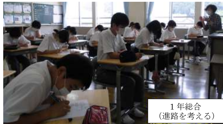
1年総合 (進路を考える)

結果は、 平日76%、休日71%の生徒が 、概ね目標を達成できたということになります。生徒全員が100%達成してほしいです。これは、学習時間についてですが、内容については、自学ノートを見れば、主体的に学習できたかどうか分かります。1学期の「ゆずの里」に書かせてもらいましたが、「あなたは、中学校で何を学んできましたか?」と問われたとき、「〇〇です。私の得意は〇〇で、これからはもっと〇〇について学んでいきたいです。」とはっきり答えられるような学習をしていきましょう。