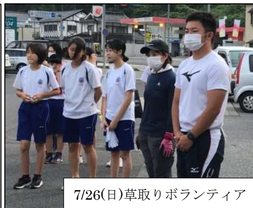
7/26(日)草取りボランティア

★親水公園の草刈りには10名以上の生徒が参加してくれました。今年の草刈りは、活気があり、はかどりました。ありがとう★ →