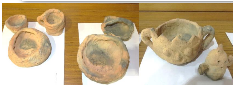
学習発表会でも展示しました。味わい深い作品です。

資料館の学芸員のご指導により、5・6年生は「弥生時代のおおい焼きで焼いた土器」を作りました。その出来栄えの良さに感心された学芸員の依頼により、現在、県立歴史民俗資料館に展示中です。来年の2月26日(日)まで展示されていますので、ぜひ、ご覧ください。