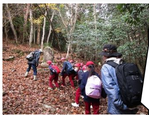
落ち葉を踏み分けて登る