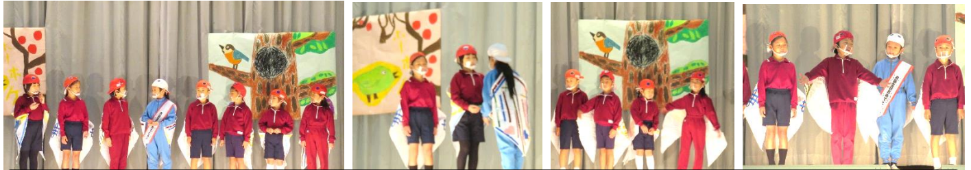
【1・2年生】道徳教材「2わのことり」の続きを考え、揺れる小鳥の心情を演じました。「大きな声」で頑張りました。

来年度こそは、地域の皆様と共に運動会も学習発表会もできることを心より願っております。