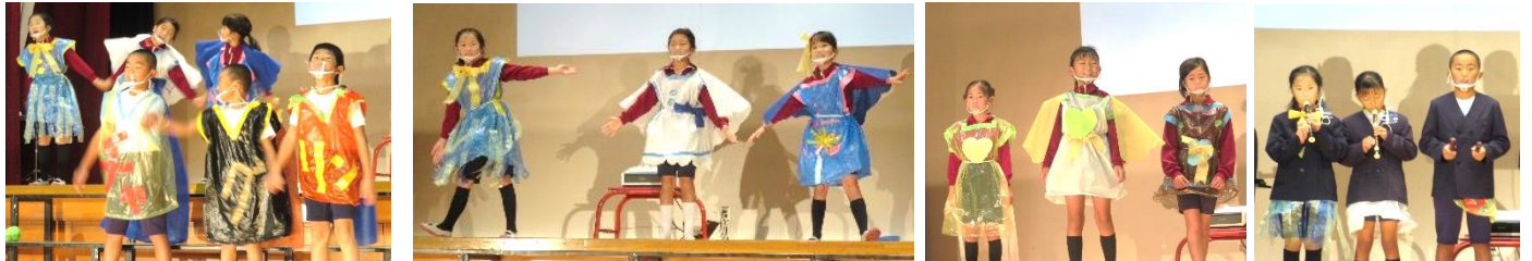
【3・4年生】「ふるさとじまんし隊」の川西レンジャーになりきり、クイズも取り入れて川西自慢を発表しました。