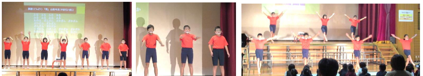
【5・6年生】川西の自然に囲まれて過ごした1泊2日の宿泊防災体験活動を、プレゼン・群読・組体操で表現しました。