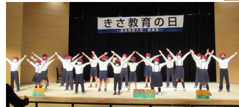
八幡小学校 オペレッタ「八幡の四季」 全員の素晴らしい表現でしたね。