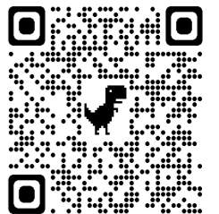
「みたまざかのうえから」

学校アンケートでも「HPでの情報発信が不十分」とのご意見をいただいていた吉舎小学校のホームページですが、11月からトップページに「新着情報」を載せ、「PTA活動」「ブログ:みたまざかのうえから」のページも増やしました。また、各種たよりのページでは、給食献立表、食育だよりも見る事ができるようになりました。ぜひ、ご覧ください。右のQRコードから、「みたまざかのうえから」のページがご覧いただけます。