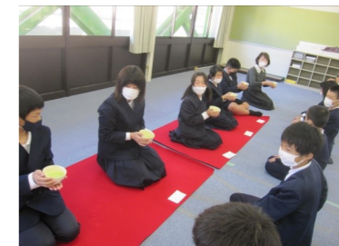
手をつけて、おじぎをするときは、親指と人さし指の間に三角を作ります。

ご指南くださる方々のお姿から、作法もさることながら、おもてなしの心も感じとることができる時間でした。