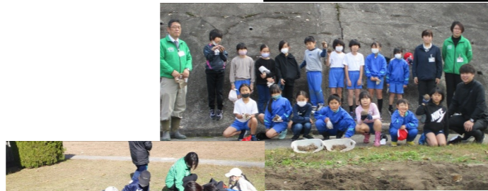
収穫を終え、みんなで記念撮影。

JAさんの指導をいただきながら、山の芋の収穫を行いました。サツマイモよりも掘り出すのは難しく、一生懸命掘りました。5月12日に植えた種芋が半年たってやっと収穫できるのですね。今年は豊作とはいきませんでした。その理由を知るのも学びになりました。