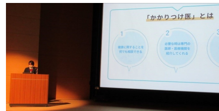
吉舎中学校 一人一研究 3年生の代表5人が発表。

吉舎小学校「歴史がいっぱい 自然がいっぱい わたしたちの吉舎町」 5年生は、吉舎の自然と特産物について、6年生は吉舎の歴史について画像あり、劇ありで楽しく発表しました。最後は6年生が考えた詩を群読。迫力でした。進行役のハンサムコロッケと山の芋子のかけ合いも絶妙でした。