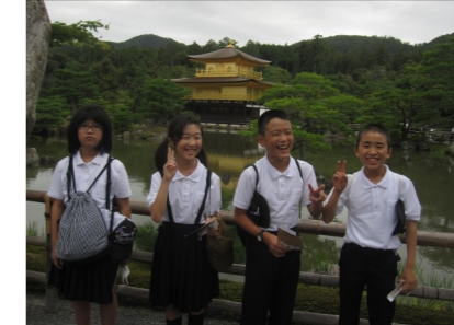
金閣寺…笑顔も輝いています。