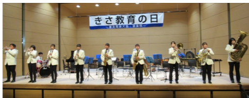
日彰館高等学校吹奏楽部