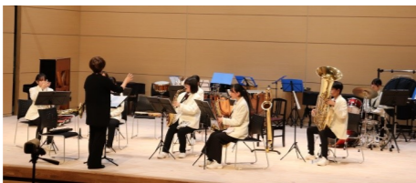
吉舎中学校吹奏楽部