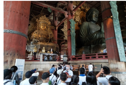
東大寺の大仏、見上げるほどです。

2日間にわたり、公共のマナーを意識しながら、自分も友だちも、そして運転手さん等お世話になっている方、訪れた先の方たちのことを意識しながら、自分たちで気持ちの良い修学旅行を作ることができました。