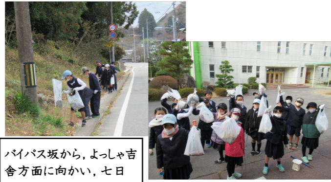
バイパス坂から、よっしゃ吉舎方面に向かい、七日市を通過して昆沙門橋を渡り、三玉坂から戻ってくるというコースでした。

総合的な学習の時間に、吉舎の自然や環境について学習してきた4年生は、自分たちができることを考え、「ゴミ拾い大作戦」を企画実施しました。吉舎の街中を歩いて拾ったごみの量はなんと、「1650g」。この結果を、4年生は代表委員会でも報告し、ゴミの無い吉舎にと呼びかけていました。