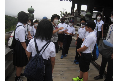
清水寺の舞台にて