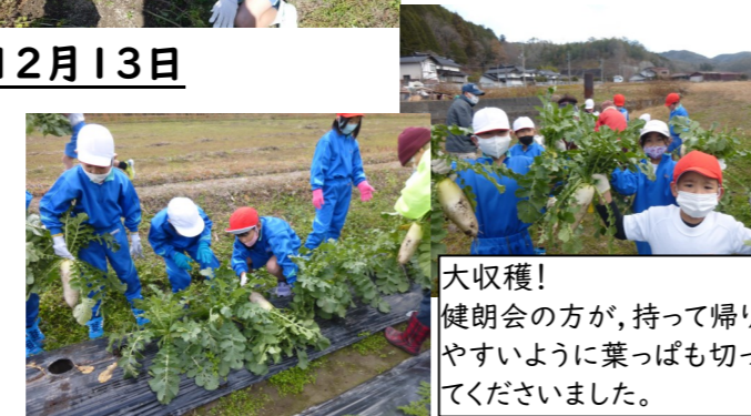
大収穫！健朗会の方が、持って帰りやすいように葉っぱも切ってくださいました。

9月29日に種まきをした大根を収穫させていただきました。ぬき方を健朗会の皆さんに教えていただきながら、姿を現す大根に、子供たちは歓声をあげていました。2か月半でこんなに大きくなるのかとびっくりです。1月には、ニンジンも収穫します。