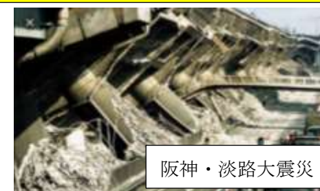
阪神・淡路大震災

今日9月1日は、「防災の日」です。97年前の9月1日は、関東大震災が起きた年です。お昼時で地震と一緒に火災が発生し、東京の町は三日三晩、焼け続けたそうです。その後、阪神大震災、東日本大震災等多くの地震による被害が日本中で起きています。現在は、地震だけでなく、水害、コロナウイルス、猛暑と連続しているいろいろな災難が日常的に起きています。これから、9月、10月は台風月です。明日、明後日の台風も心配ですが、災害にならなければと願っています。