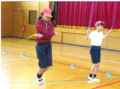
個人跳び（跳び方は各自で選択）