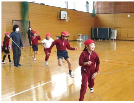
八の字跳び（3分間で跳んだ延べ回数）